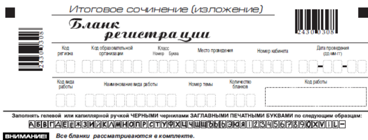
Рис. 2. Верхняя часть бланка регистрации

По указанию члена комиссии образовательной организации участником заполняются все поля верхней части бланка регистрации (см. табл. 1).