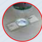
Силиконовая подложка и нижняя подсветка