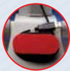
Шнур питания наматывается на держатель на задней стенке микроскопа