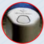
Кнопка для захвата фото и видеоизображения