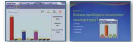
Экраны с тестами и таблицами результатов