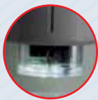
Легко поворачивающаяся турель с объективами и верхней подсветкой